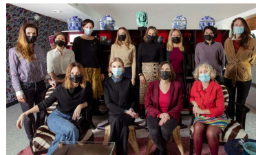
Jury du Prix Sisley Beaux-Arts de Paris pour la Jeune Création 2021