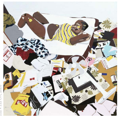
© Ymane Chabi-Gara, Hikikomori 4, Acrylique sur contreplaqué, 122 x 122 cm, 2020

Ce prix co-créé par Sisley et les Beaux-Arts de Paris a pour vocation de promouvoir la jeune création tout en soutenant la place des femmes dans l'art et la société . Depuis 2020, cette distinction, décernée à un jeune talent homme ou femme, récompense le lauréat en lui offrant une bourse de 5.000€, ainsi qu'une exposition chez Sisley à Paris, pour l'aider dans le lancement de sa carrière.