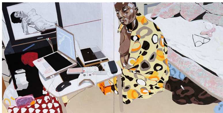
© Ymane Chabi-Gara, Hikikomori 2, Dîpbyque, acrylique sur contreplaqué, 122 x 244 cm, 2020

L'artiste y présente sa série de peintures sur bois "Hikikomori", composée de grands formats (jusqu'à 122 x 244 cm) ainsi que des petits formats inédits (24 x 32 cm) inspirés de cette même série.